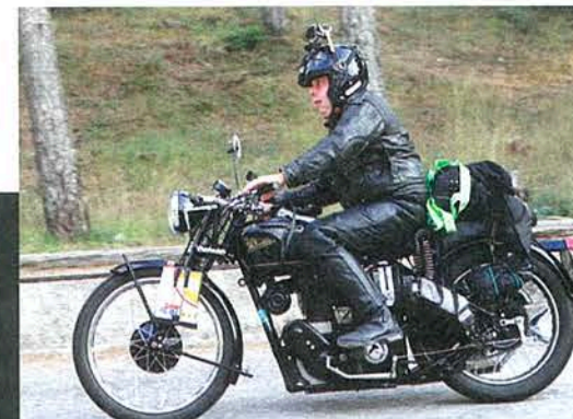
▲ Toutes les anglaises sont les bienvenues, à commencer par cette Velocette MSS de 1947, la plus ancienne machine du plateau.