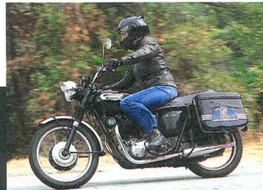
▲ Chez les Paulet, on roule exclusivement en anglais : voici Pascale sur sa Bonneville de 1968.